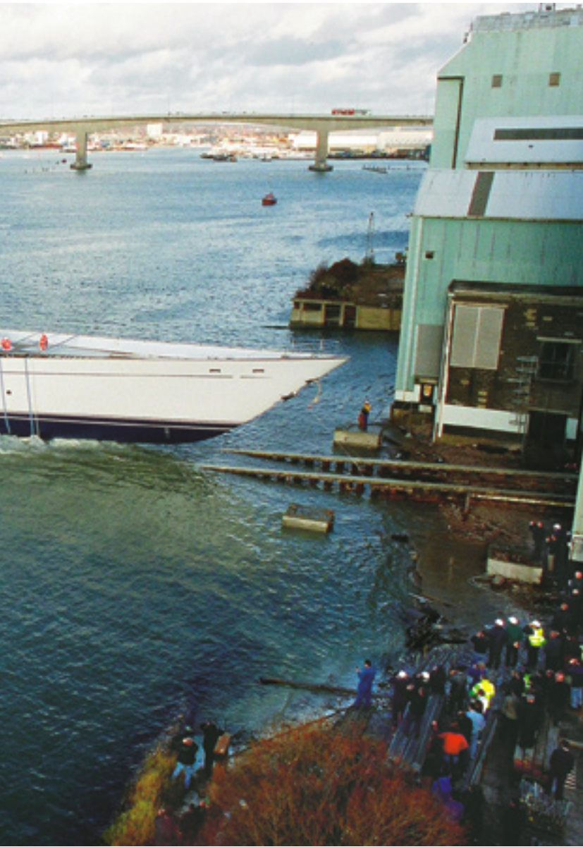
m ad dlkasjdfofj lkj lkjl lk lk lk jlk j lkj lk jl kj lk jlkj lkjlkjlkjlkolum volorem nos adignit veliquisse.

anden. Yachtens egen vinkælder vil ifølge sejlbadens ejer altid ligge inde med det ypperste fra druedyrkernes verden.