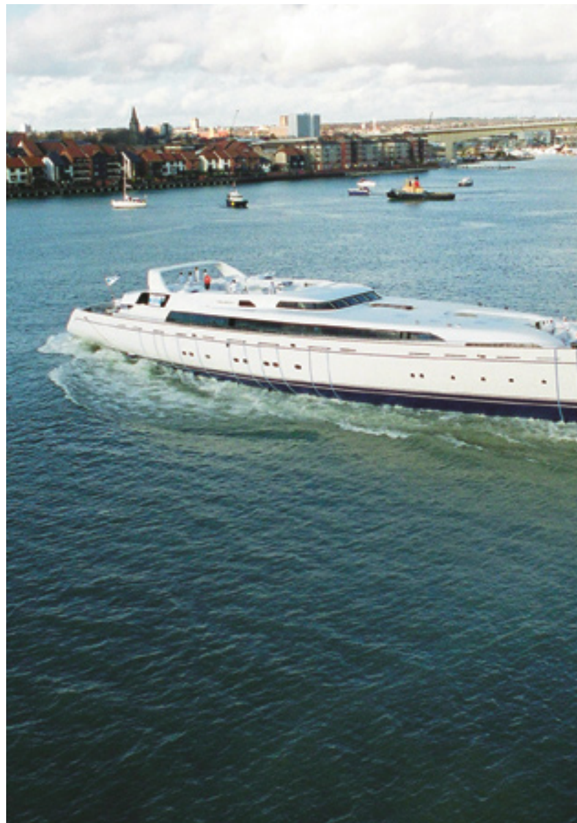
Lor accum verilit, si blandreril et dit augiar

går hen og bliver til en forretning for ham. Selvom der ikke er tvivl om, at den 69-årige matador med base i Florida er en passioneret sejler, så lever forretningsmanden i ham stadig.