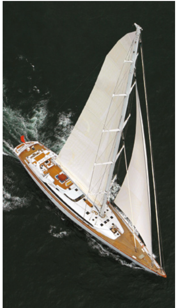
Lor accum verilit, si blandreril et dit augiam ad dlkasjdfofj lkj lkjl lk lk lk jlk j lkj lk jl kj lk jlkj lkjlkjlkjlkolum volorem nos adignit veliquisse.

Udlejningspris pr. uge: (250.000 dollars) 1,5 mio. kr.