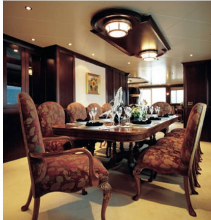
Den danske producent Royal Denship rider med på bølgen og leverer luksus i større og større målestok.

OCTOPUS slog den tidligere rekordindehaver, 73 år gamle SAVARONA, med fem flade fod i længden. En halvanden meters penge, der ganske givet ikke var tilfældigt målt ud på designerens bord. Hverken værft eller ejer vil dog kommentere eller uddybe noget som helst i forbindelse med OCTOPUS.